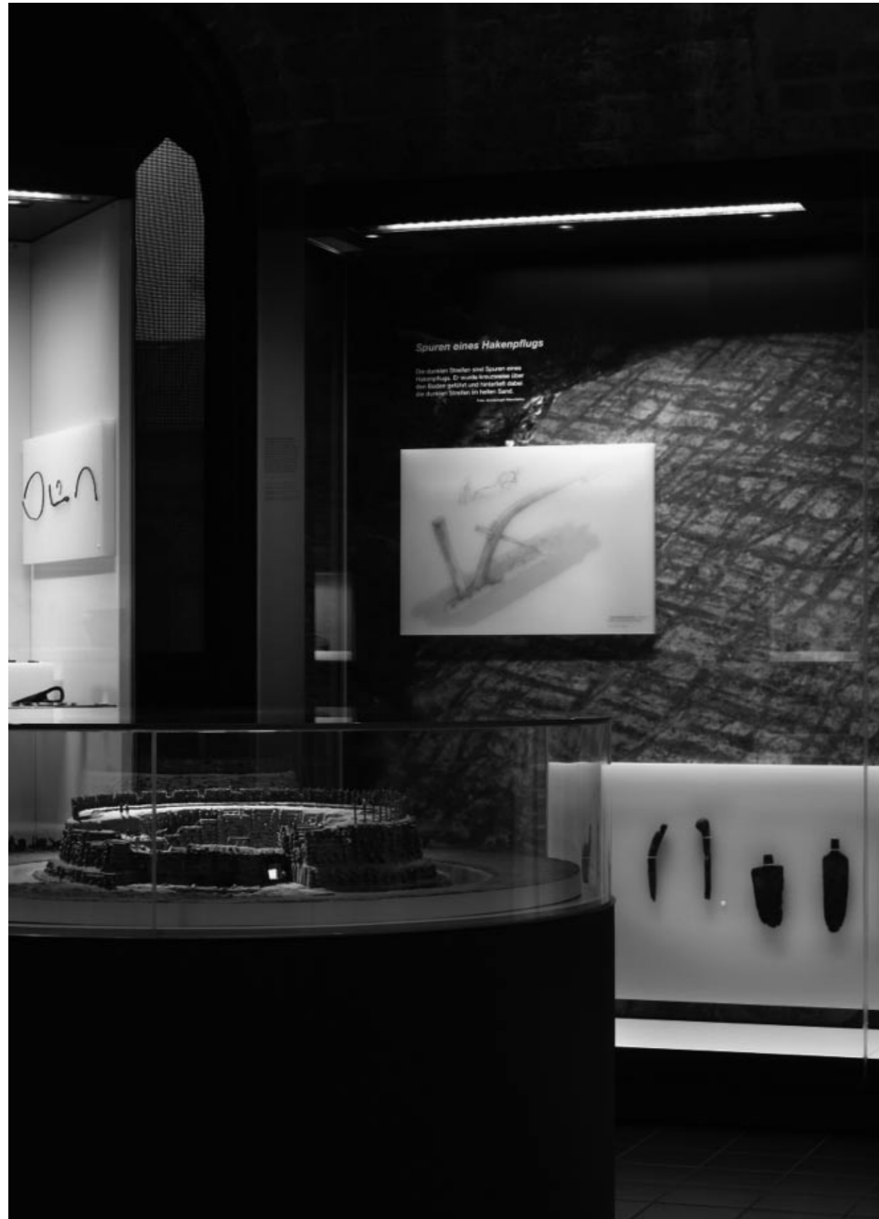
Archäologisches Landesmuseum Brandenburg im Paulikloster, Brandenburg an der Havel