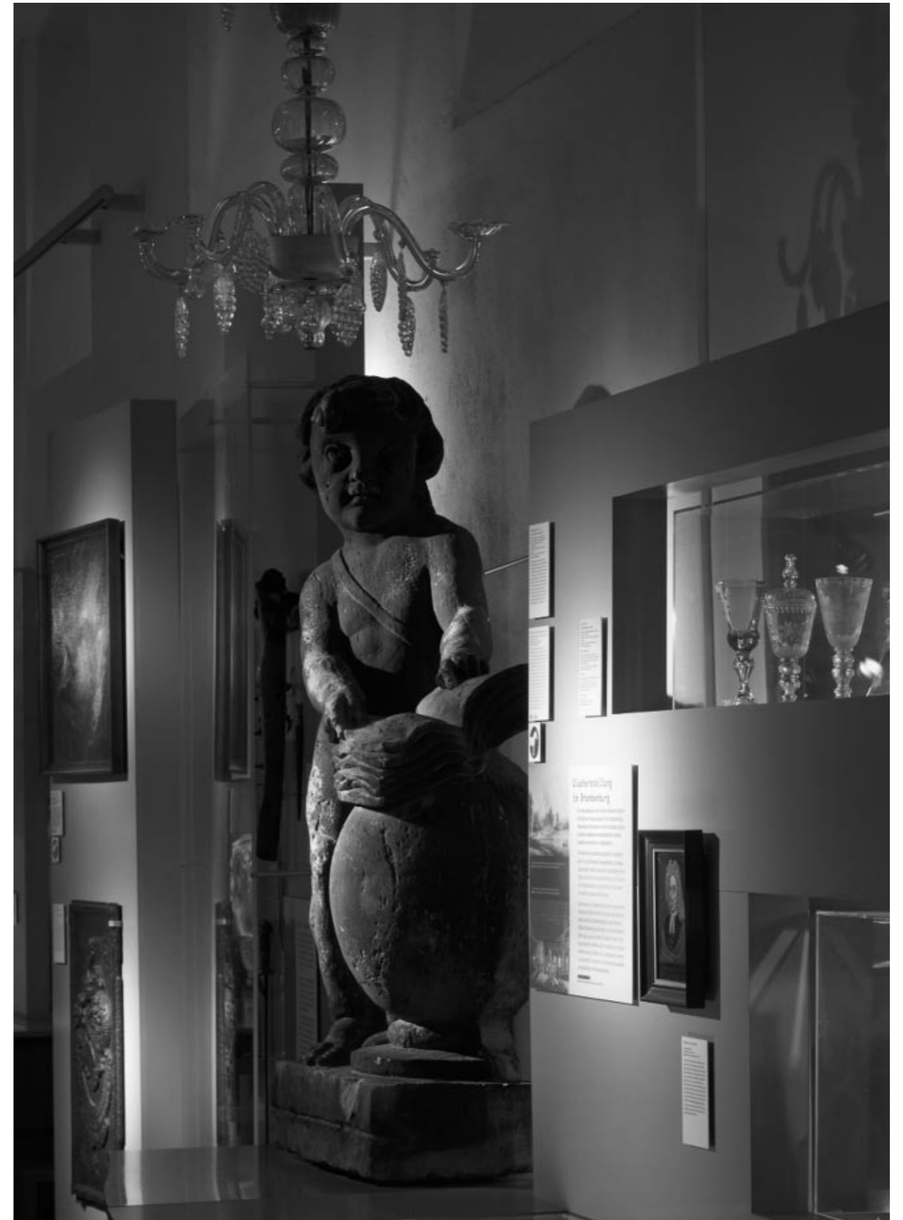
Haus der Brandenburgisch-Preußischen Geschichte, Potsdam