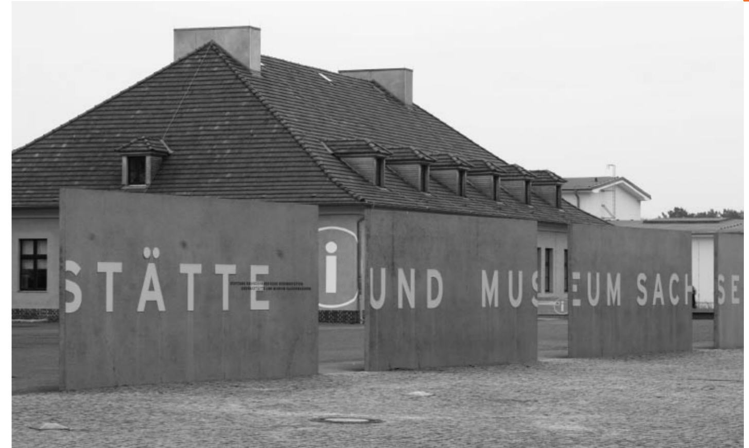
Gedenkstätte und Museum Sachsenhausen