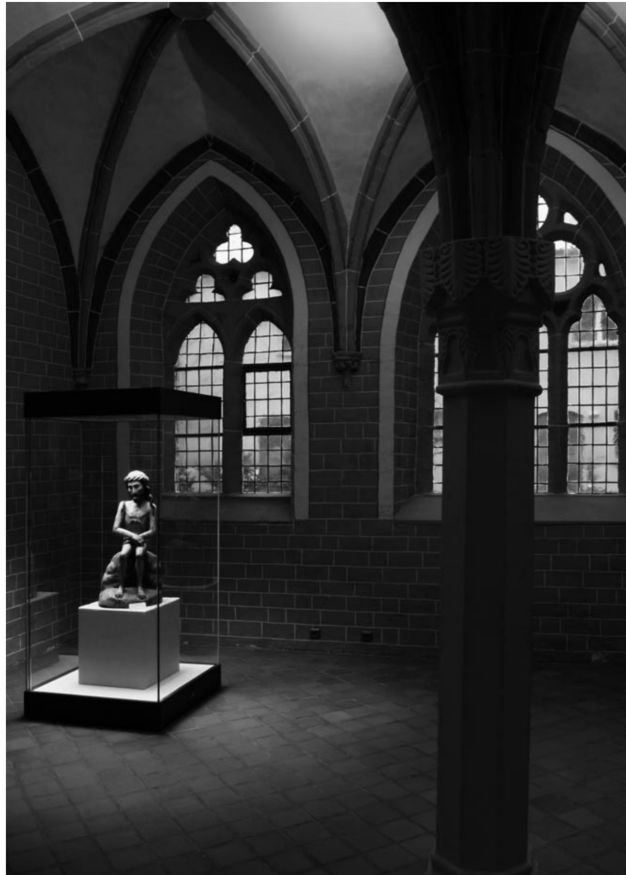
Kulturhistorisches Museum im Dominikanerkloster, Prenzlau