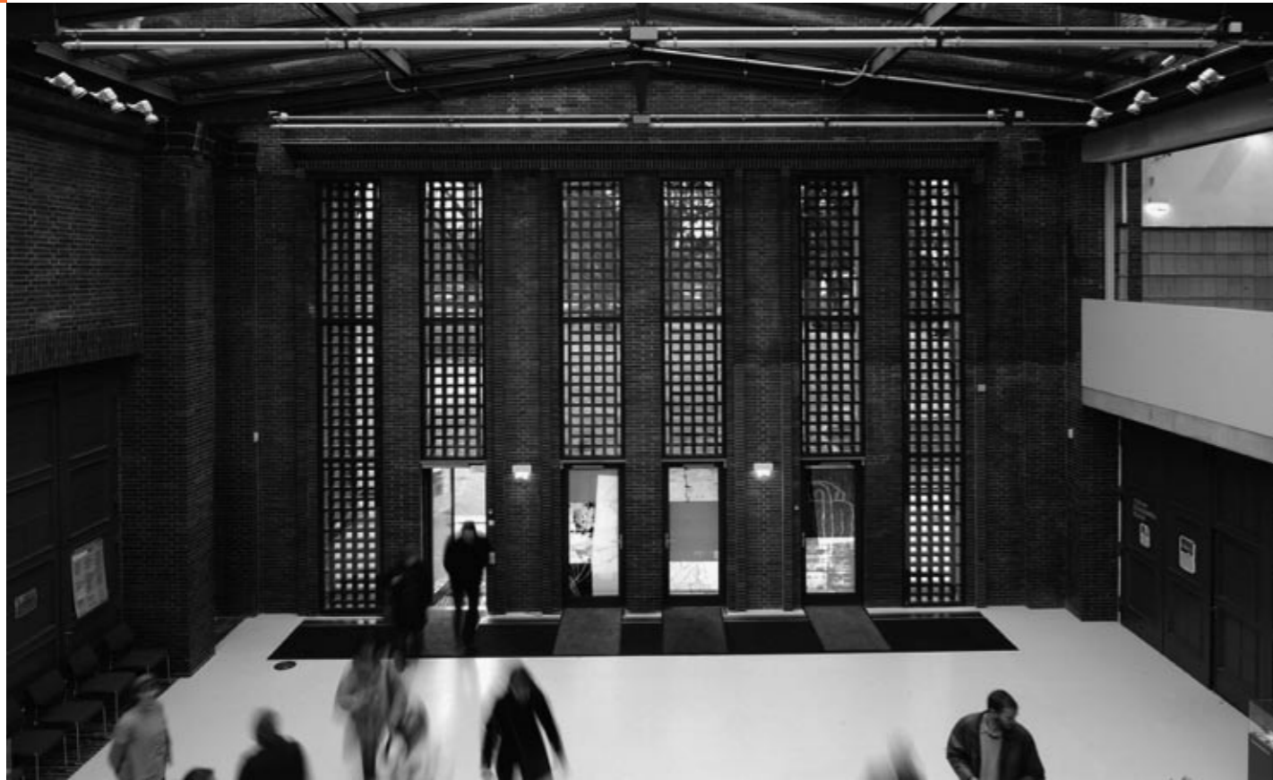
Kunstmuseum Dieselkraftwerk Cottbus