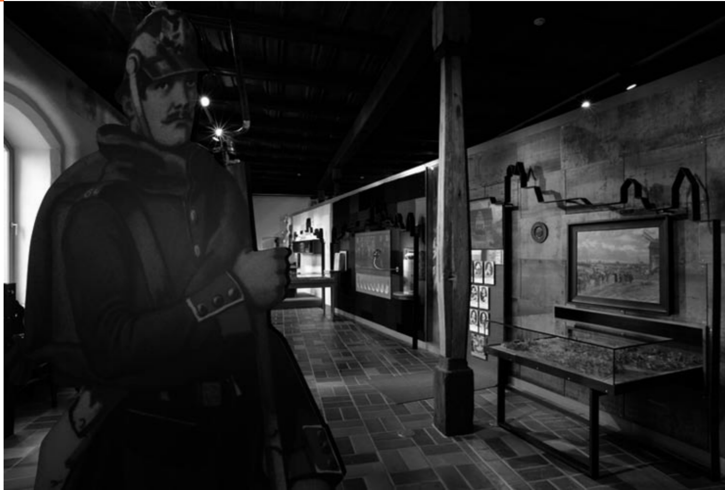
Museum im Mönchenkloster, Jüterbog